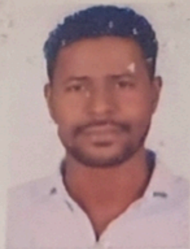
Azam Elhassan Monitor 1-695THY CMS Gulf